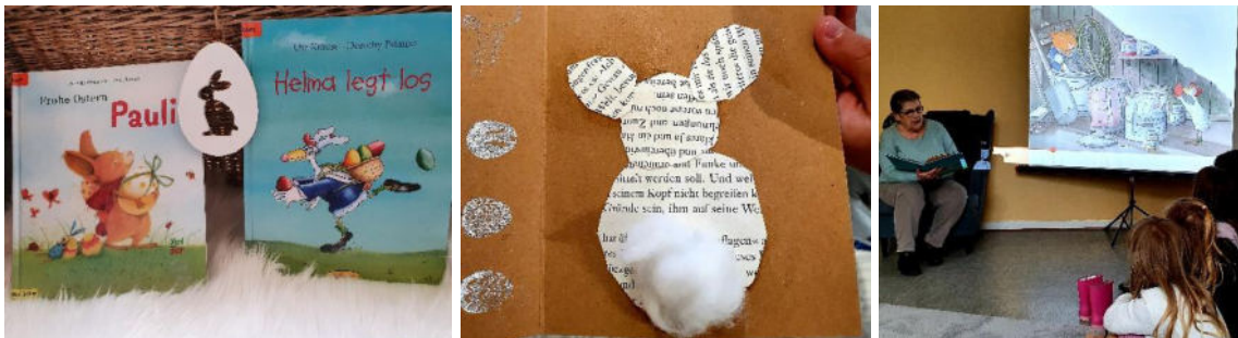
3.Bild: Frau Steinle (ehrenamtliche Vorleserin)

Das Bilderbuchkino (für die Großleinwand animierte Bilderbücher) ist von dem Anbieter onilo . Die Lizenz dazu wurde uns auch 2022 im Rahmen des Lesefests vom RTK finanziert. Ein wunderbares Werkzeug der Leseförderung, da es das Betrachten des vorgelesenen Bilderbuchs auch für größere Kindergruppen ermöglicht.