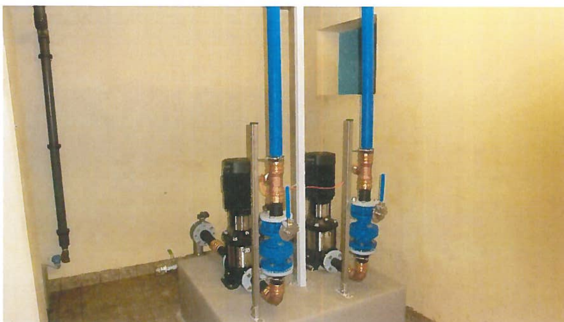
Abbildung 7: neue Pumpen in Aufbereitung Vollradserallee