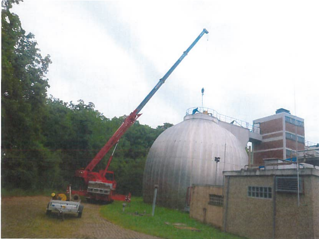
Abbildung 7: Demontage der Gashaube, Faulturm KA Grünau