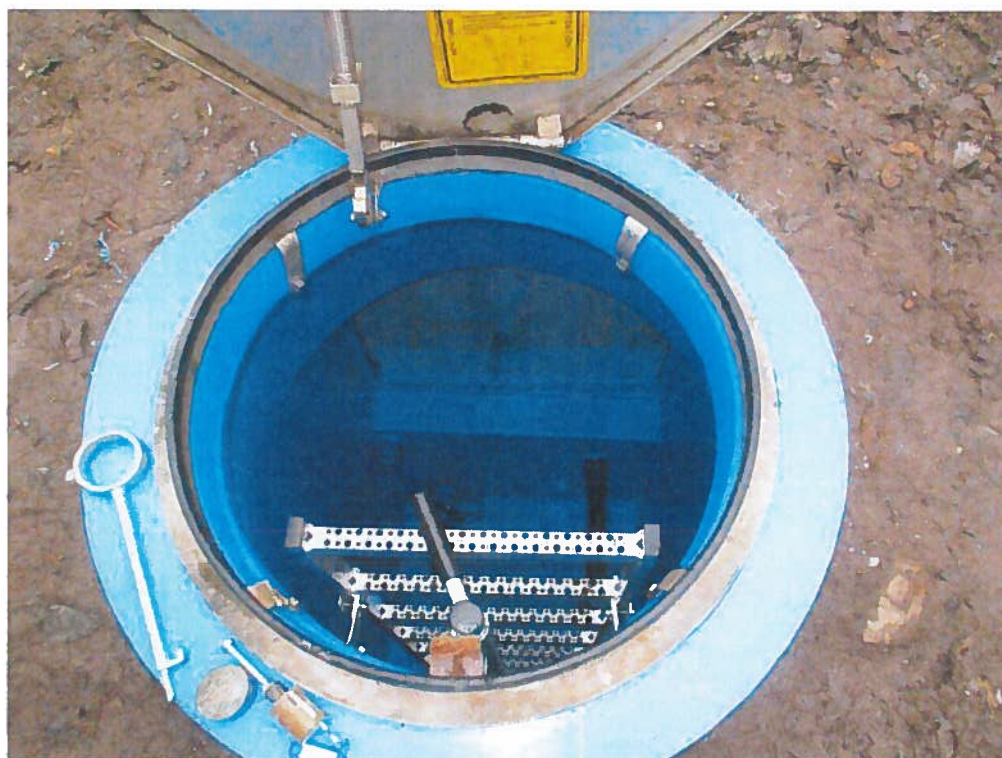
Abbildung 1: saniertes Einstiegsschacht