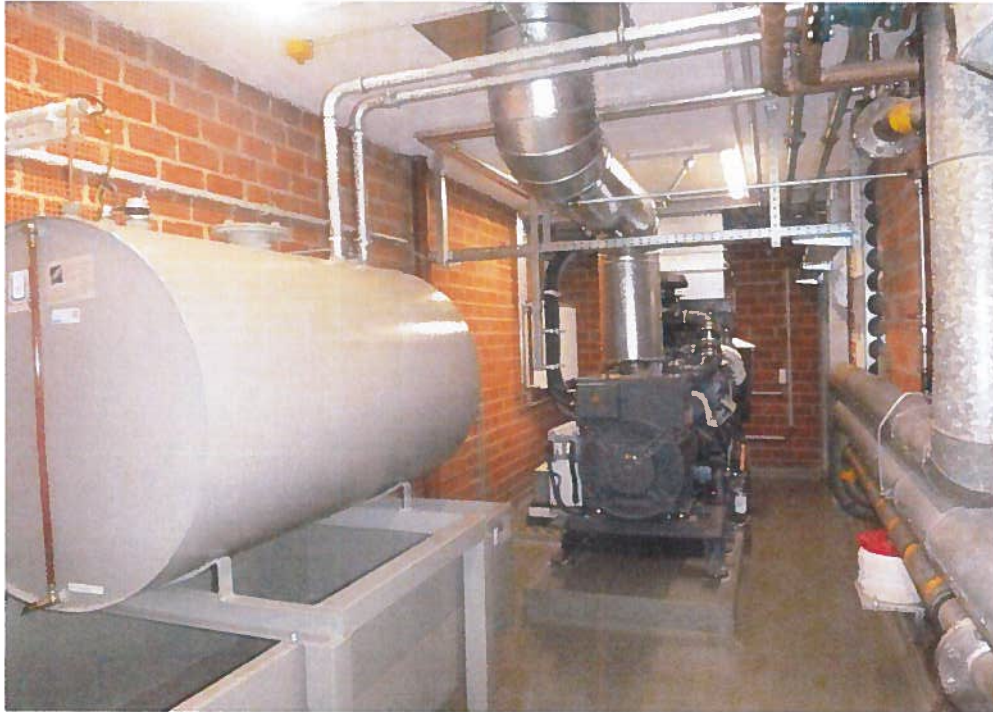
Abbildung 1: neues Notstromaggregat, KA Grünau