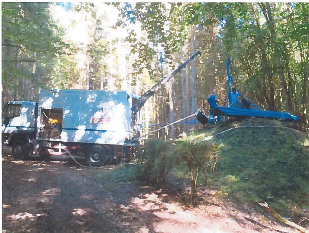
Abbildung 6: Regenerierung Brunnen 3, Schlangenbad