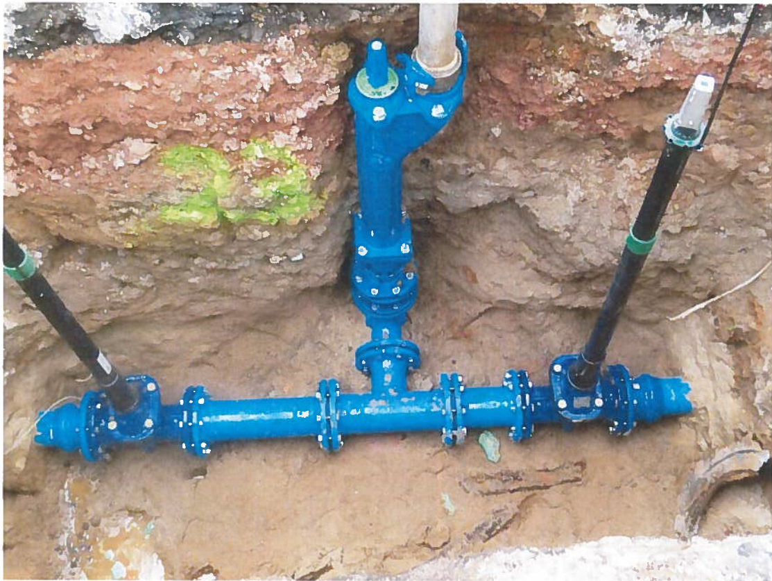
Abbildung 4: Leitungsneubau Hallgartener Straße, Hattenheim