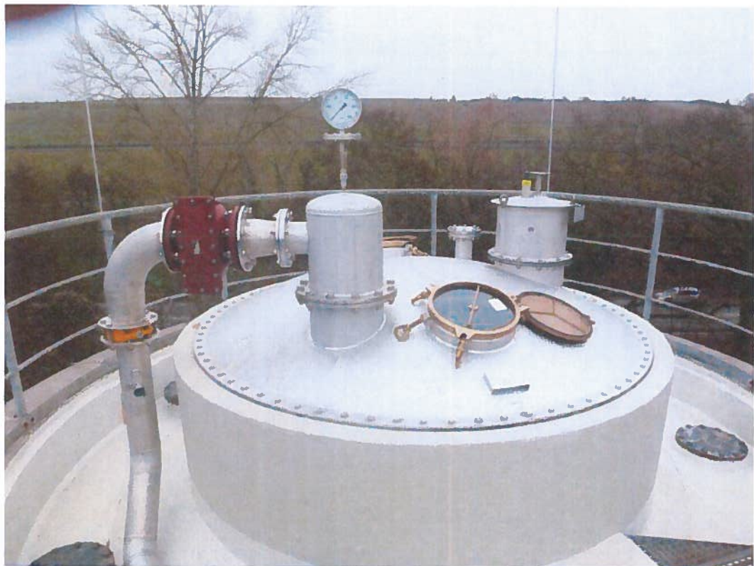
Abbildung 8: neue Gashaube, Faulturm KA Grünau