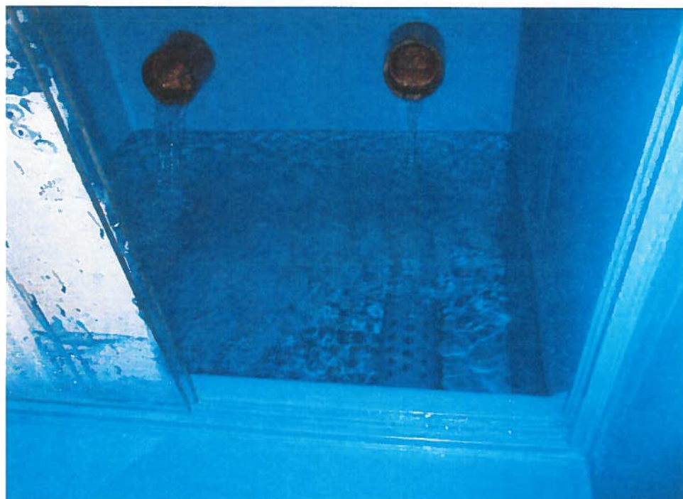
Abbildung 2: saniertes Schacht Quelle Martinthal