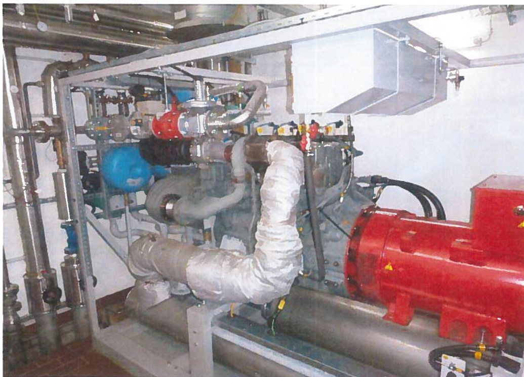
Abbildung 2: neues BHKW, KA Grünau