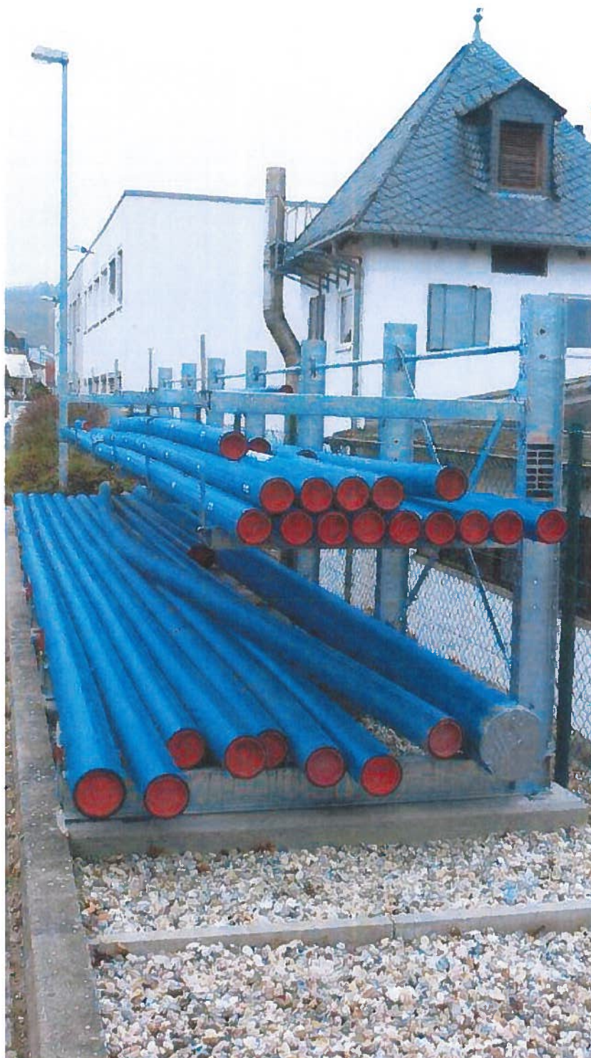
Abbildung 3: neues Rohrlager, Eltville