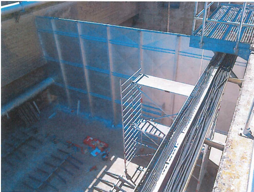
Abbildung 6: neue Trennwand, KA Grünau