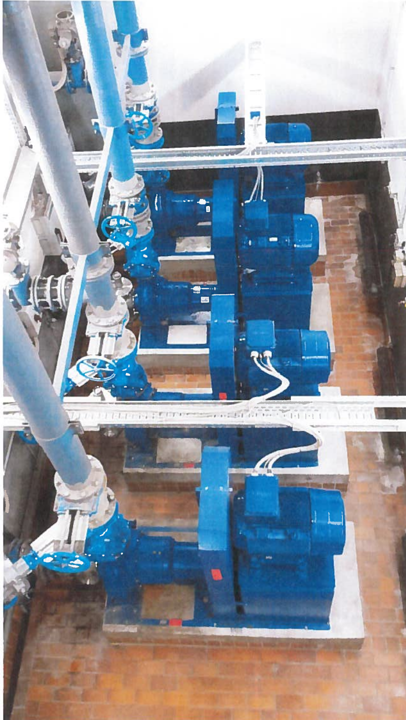
Abbildung 9: Einbau zwei neuer Förderpumpen, PW Walluf