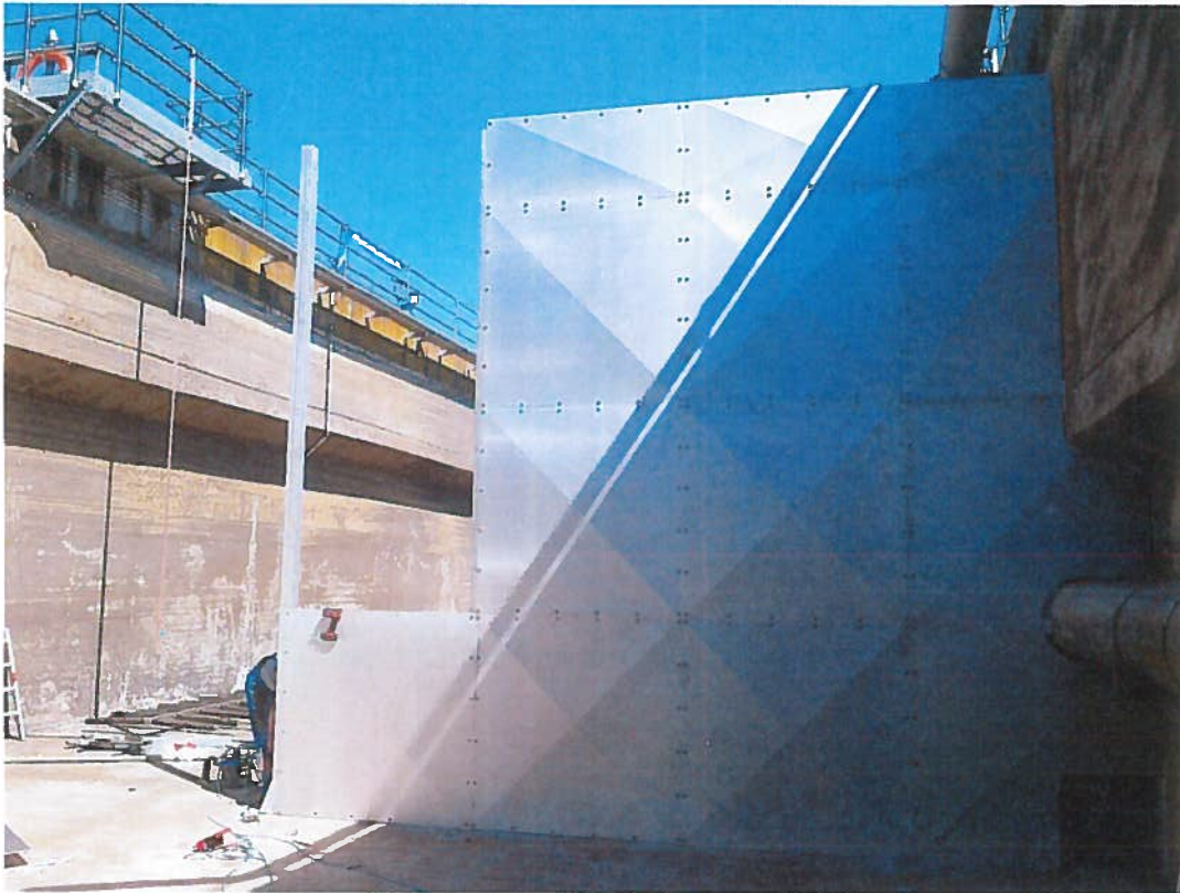
Abbildung 5: Einbau der neuen Trennwand, KA Grünau