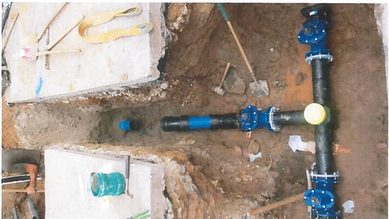
Abbildung 5: Leitungsneubau Rosenthalstraße, Hallgarten