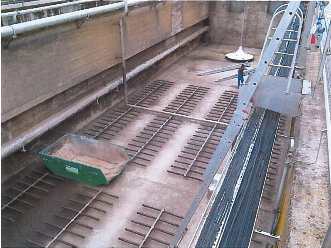
Abbildung 3: Austausch Belüftung Belebungsbecken, KA Grünau